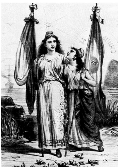
(Ângelo Agostini, Reconhecimento da República brasileira pela França , em Revista Ilustrada, dez.1889.)