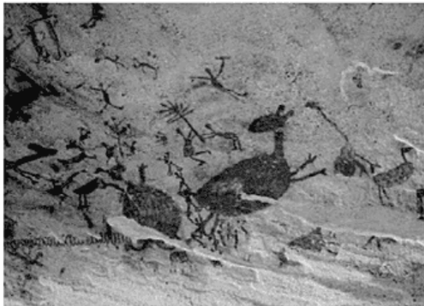
Pintura rupestre da Toca do Pajaú – PI.

A pintura rupestre mostrada na figura anterior, que é um patrimônio cultural brasileiro, expressa