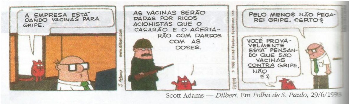
Scott Adams — Dilbert . Em Folha de S. Paulo , 29/6/1998.

O humor crítico dessa historinha baseia-se num jogo de sentido obtido pelo emprego de duas preposições. Explique o que o funcionário de gravata entendeu com a primeira fala do outro personagem e o que este, na verdade, pretendeu dizer.