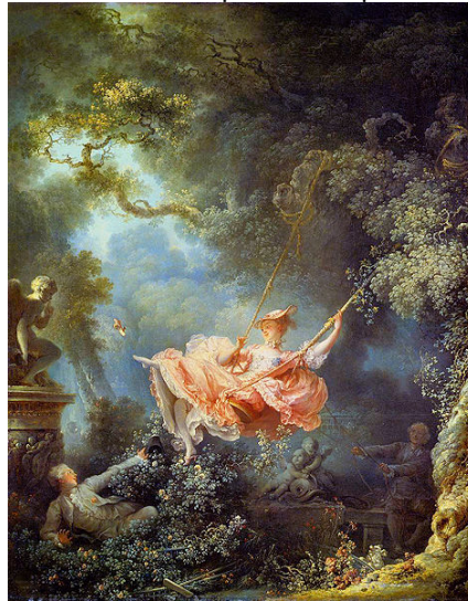
Fragonard, O balanço .

01. O Rococó estava associado ao excesso, à desmedida e aos detalhes ornamentais. Considere a pintura abaixo como uma representante desse estilo e responda as questões seguintes.