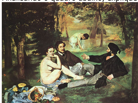
Almoço na relva, 1863.

05. Manet foi um artista que questionou os valores de seu tempo e inovou a pintura dando-lhe uma luminosidade intensa. Analisando o quadro abaixo, explique o uso da luz, sombra e cores deste artista.