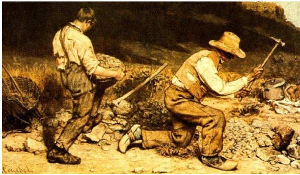
Os quebradores de pedra. Gustave Courbet, 1850.