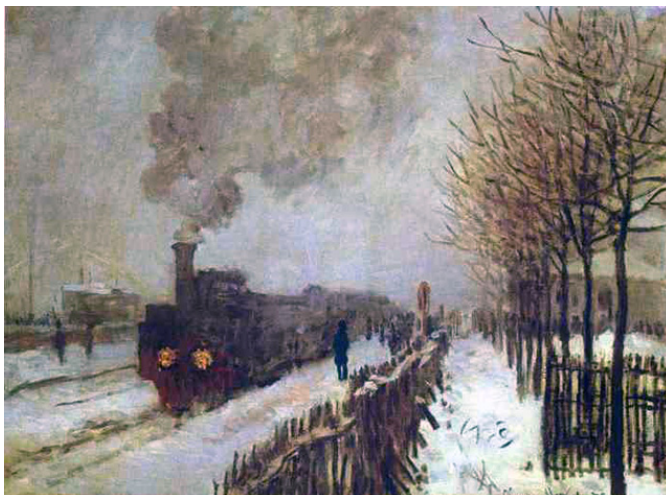
O trem, na neve. MONET, Claude, 1875.