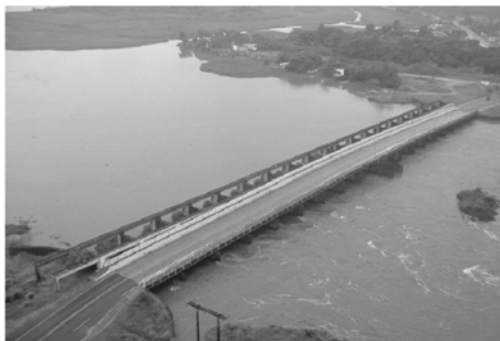
Imagens de Valo Grande hoje com quase 400 m de largura. Foi aberto no século XIX com 4 m de largura

Acima, podemos observar o Valo Grande, canal construído no século XIX no rio Ribeira de Iguape, litoral do Estado de São Paulo, com objetivo de dinamizar o escoamento da próspera produção agrícola, especialmente do arroz, nessa região. Esse canal é conhecido como um dos mais trágicos desastres ambientais decorrentes do desvio de um rio. Durante as cheias, as águas desviadas para o trecho artificial, sem os meandros para domar sua velocidade, ocasionam um intenso solapamento de suas margens. Os sedimentos, então, são depositados no porto de Iguape.