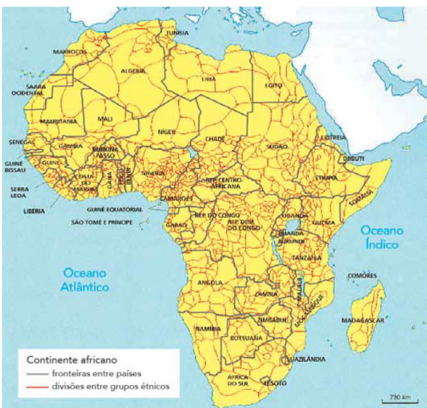
Adaptado de OLIC, Nelson Basic; CANEPA, Beatriz. África: terra, sociedades e conflitos. São Paulo: Moderna, 2012.

06. Uma das contradições que afetam as sociedades africanas é a não correspondência entre as fronteiras territoriais dos diversos Estados-nacionais e as divisões entre grupos étnicos locais, como se observa no mapa abaixo: