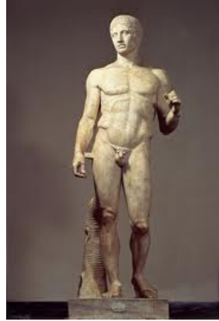
Doríforo, de Policleto, 450-440 a. C

06. (UNESP) Observe e compare as imagens seguintes.