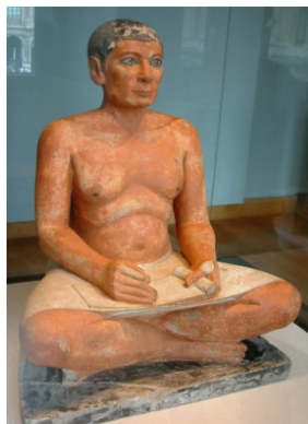
Escriba sentado, por volta de 2620 a 2500 a.C (IV dinastia). Museu do Louvre.

06. (UNESP) Observe e compare as imagens seguintes.