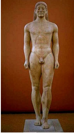
Kouros sepulcral de Anavysos, c540-525 a.C.