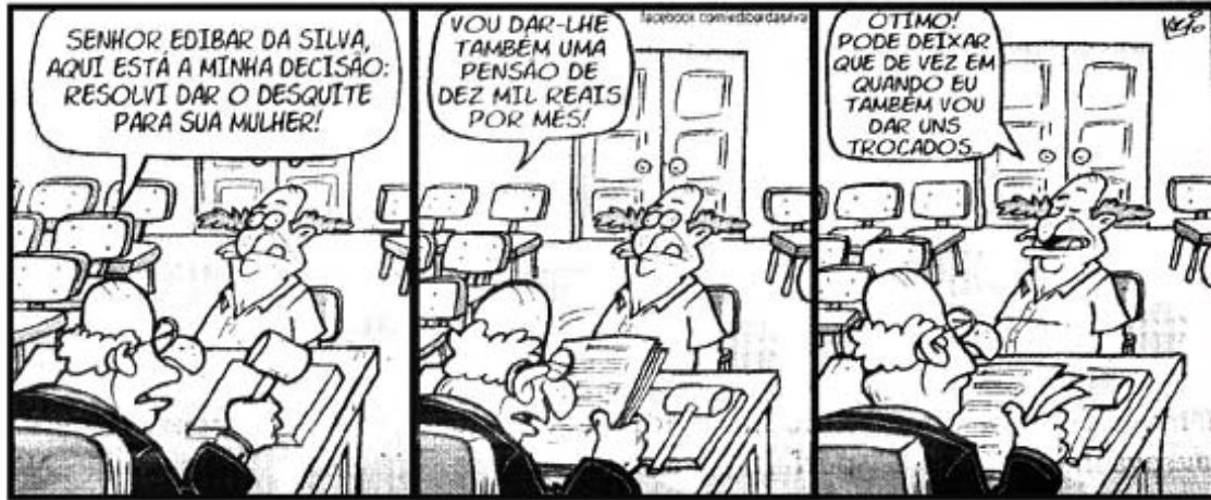
(Edibar. Folha de Londrina. 18 jun. 2014. Folha 2. p.2.)

A tirinha apresenta um ruído na comunicação entre as personagens.