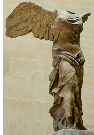
Fig. III Nike de Samotrácia. 190 a.C.

02. Pesquise e aponte as principais características do Período Helenístico.