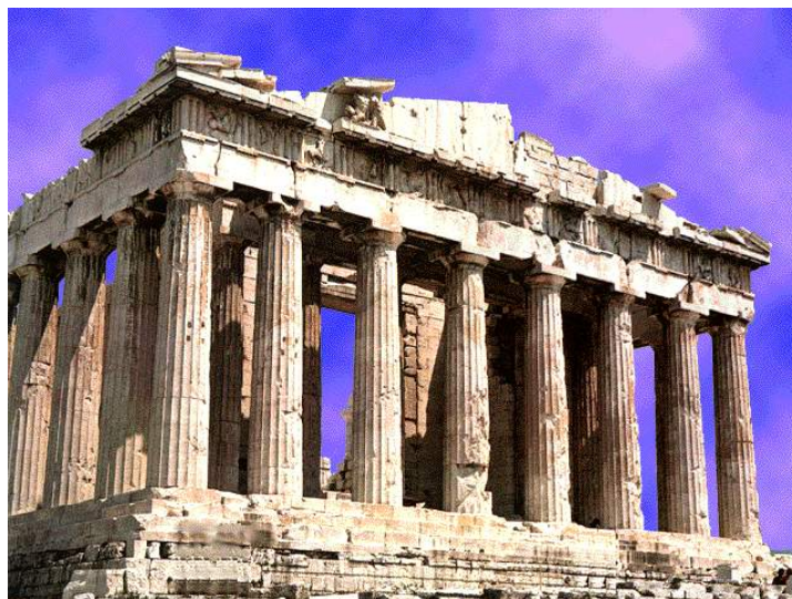
Partenon, séc. V a.C.

04. Explique as características principais dos templos gregos a partir da imagem abaixo.