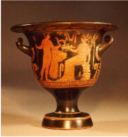
Fase das figuras vermelhas.