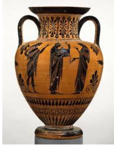
Fase das figuras pretas.