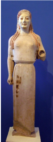
Fig. I Koré do Peplos. 540 a.C.

01. Identifique o período de cada escultura abaixo e comente as características que justificam sua resposta.