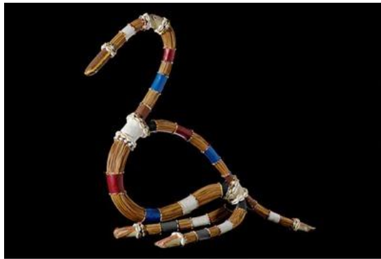
Pepeye - O Grande Pato 2001 - técnica mista - 60x60x23