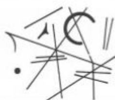
FIGURA 2.13 (TENSÃO)

A Figura 2.12 é um exemplo de uma composição que possui a ideia de repouso, já a Figura 2.13 é tensão.